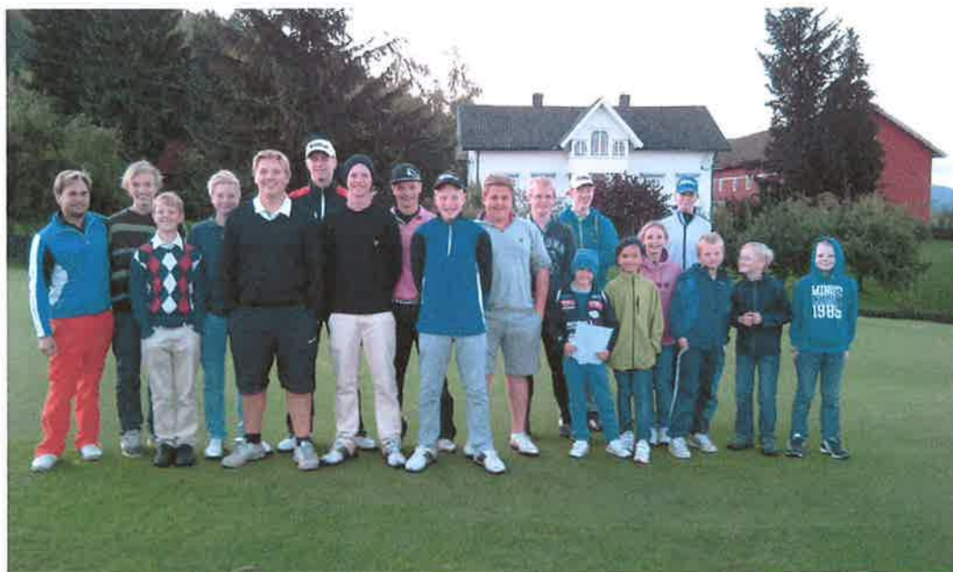
Deltakere på NGKs junior avslutningsturnering.