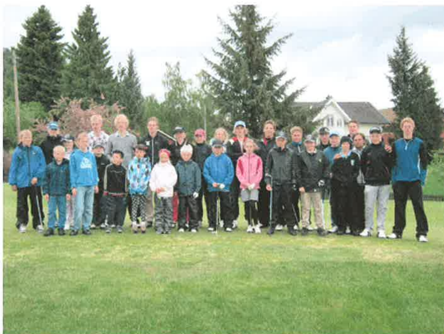
Besøk fra Grenland golfklubbens juniorgruppe.

http://www.golfliga.no/wip4/detail.epl?cat=18397