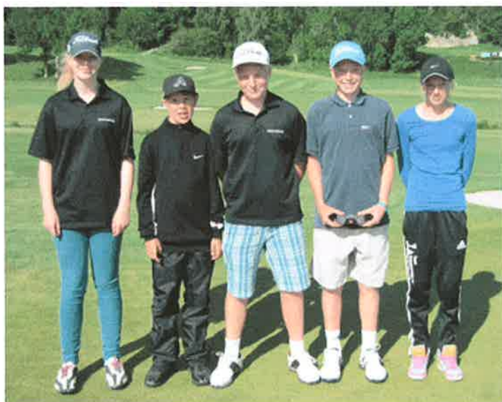
Junior Tour turneringer.

Vi fikk tilsendt gratis 'Tri-golf'utstyr (verdi ca. kr. 5.000) fra Norges golfforbund med plast golf køller og andre innendørs treningsutstyr som Lunde barneskole har fått låne i gymtimene.